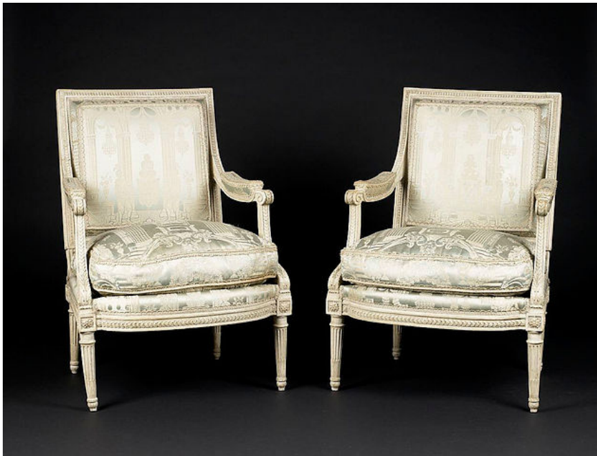
Afbeelding 1. Stoelen.

Iedereen weet natuurlijk dat een stoel gemaakt is om op te zitten. Waarschijnlijk zit je zelfs op een stoel terwijl je dit leest. Maar is het eigenlijk wel zo logisch dat het mogelijk is om op een stoel te zitten?